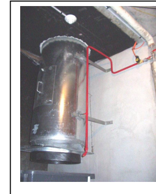
Protection sous colonne