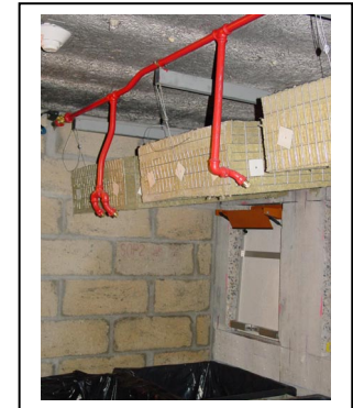
Protection derrière Trappes Passe Paquets